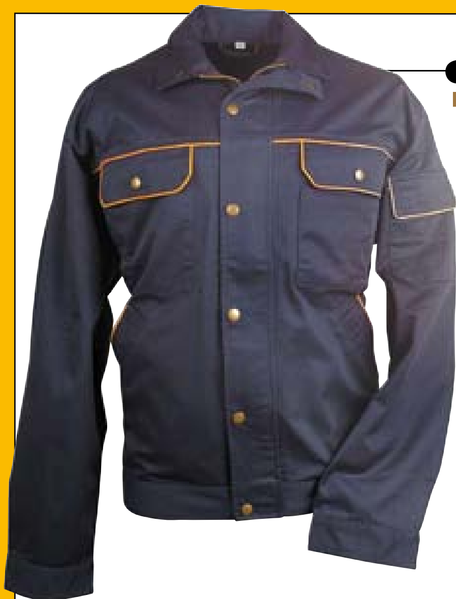
Art. 460BC TOP TEAM [CE EN 340]