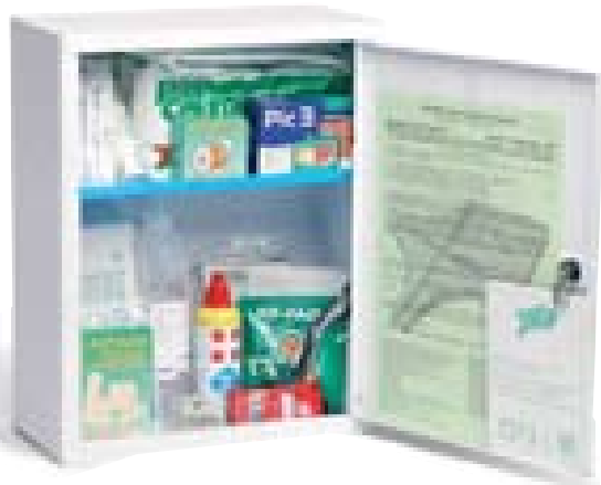
Art. 120CPS [DM 388 del 15/07/03]