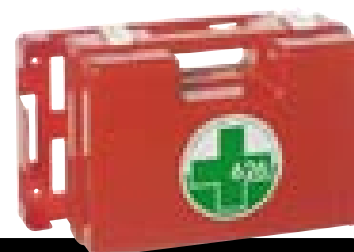
Art. 122 CPS [DM 388 del 15/07/03]