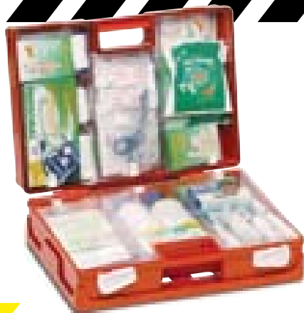
Art. 123 CPS [DM 388 del 15/07/03]