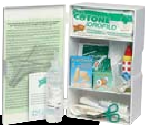
Art. 1500 [DM 388 del 15/07/03]