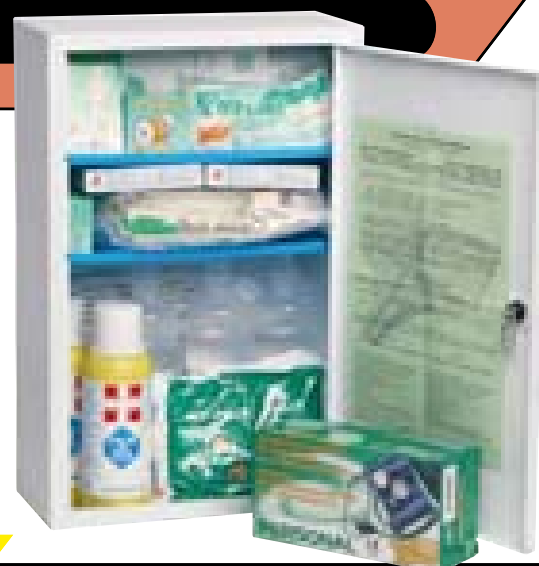
Art. 1512 [DM 388 del 15/07/03]