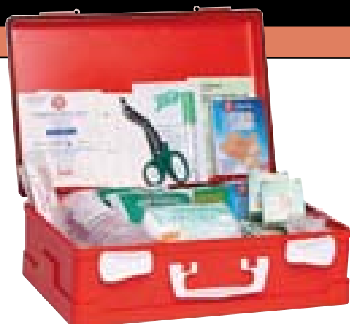
Art. 1434 [DM 388 del 15/07/03]