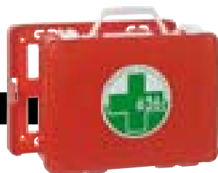
Art. 1400 [DM 388 del 15/07/03]