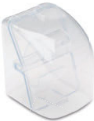
T27008 ASTUCCIO APPENDIBILE PER OROLOGIO in plastica trasparente. Imballi: 100/25 Materiale: plastica Dimensioni: 6,3x8,5x8,2 cm.