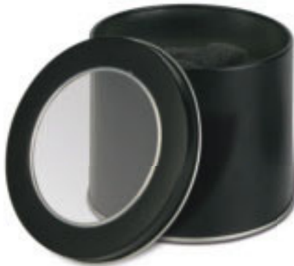
T27044 ASTUCCIO PER OROLOGIO in metallo con talloncino garanzia. Imballi: 150/50 Materiale: metallo Dimensioni: Ø 9,5x8 cm.