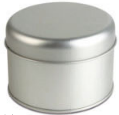
T27046 ASTUCCIO PER OROLOGIO in metallo con talloncino garanzia. Imballi: 150/50 Materiale: metallo Dimensioni: Ø 9,5x6,5 cm.