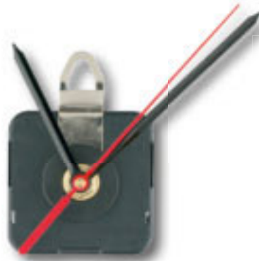
Z50500 MOVIMENTO OROLOGIO PARETE gambo corto (0,5 cm), fornito con lancette dritte o stilizzate. Imballi: 250/50 Materiale: plastica/metallo Dimensioni: 5,5x5,5x1,8 cm.