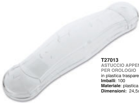
T27013 ASTUCCIO APPENDIBILE PER OROLOGIO in plastica trasparente. Imballi: 100 Materiale: plastica Dimensioni: 24,5x5,7x2,4 cm.