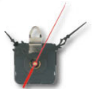
Z50501 MOVIMENTO OROLOGIO PARETE gambo lungo (1,4 cm), fornito con lancette dritte o stilizzate. Imballi: 250/50 Materiale: plastica/metallo Dimensioni: 5,5x5,5x1,8 cm.