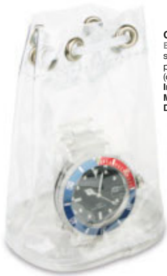
Q24231 BORSETTA PORTAOROLOGIO simpatica borsetta trasparente portaorologio con cordicella in nylon (orologio non incluso). Imballi: 400/100 Materiale: pvc Dimensioni: Ø 7x11 cm.