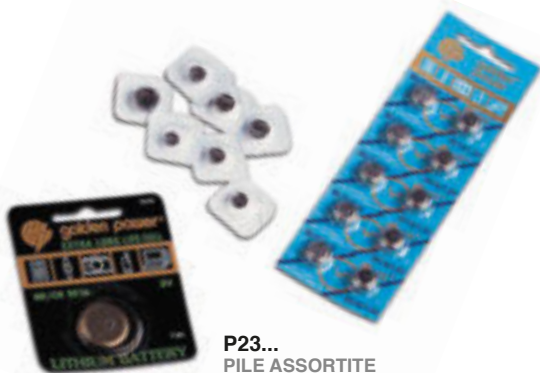
P23... PILE ASSORTITE