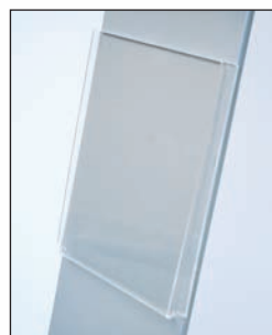
Tasca vela formato A4