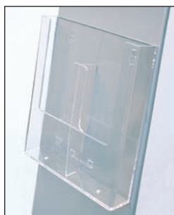
Tasca portabrochure 2 formati 1/3 di A4