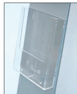
Tasca portabrochure TYW230 formato A4