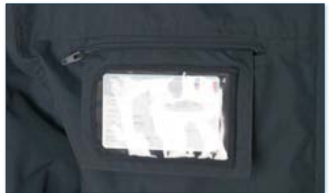
Portabadge estraibile a scomparsa