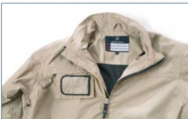
Portabadge estraibile a scomparsa