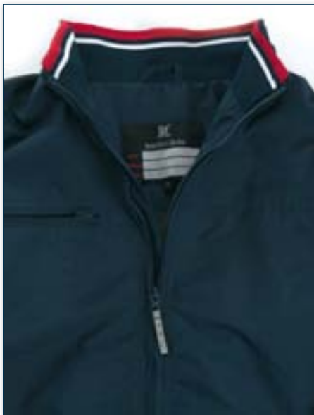
Interno collo in maglia elasticizzata