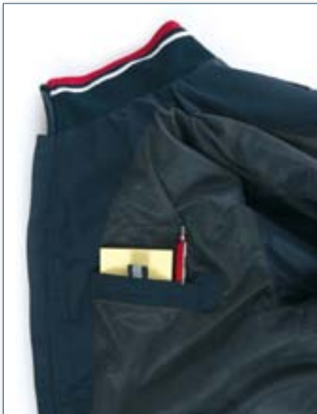
Tasche interne portafogli