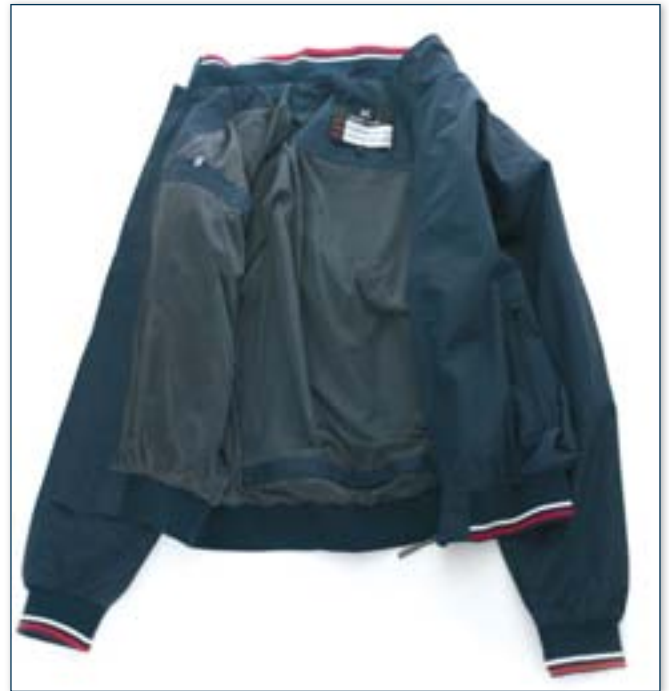
Fodera retinata con zip sul fondo per personalizzazioni