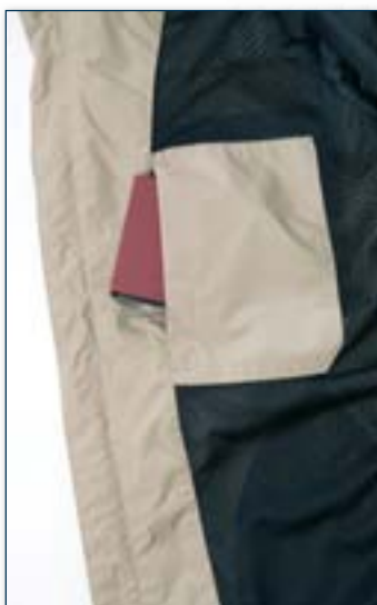
Tasca interna portafoglio